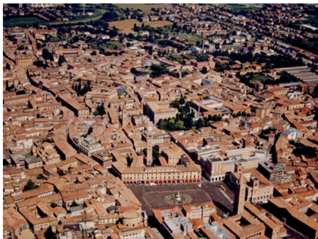
Vista del centro storico di Forlì

Il miglioramento della sostenibilità energetico-ambientale si potrà raggiungere attraverso un range di azioni che includano azioni mirate a modificare le abitudini dei cittadini attraverso nuovi servizi e informazioni (per es. Bike-sharing, la settimana della mobilità sostenibile dal 16 al 22 Settembre) e azioni mirate al miglioramento della distribuzione merci (progetto SMARTSET).